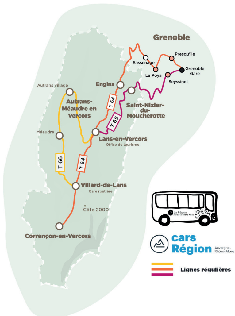
Plan des lignes du Vercors

Plusieurs formules d'abonnement permettent d'opter pour ce transport économique et régulier.