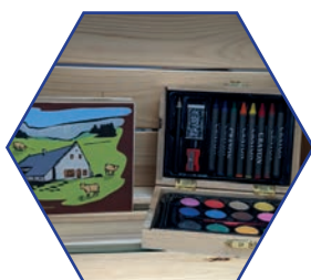
Palettes de peinture