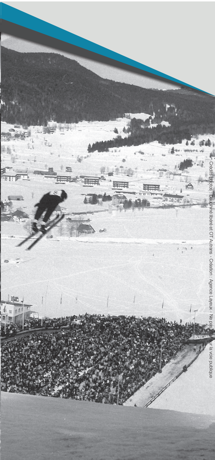
Credits photos : Dauphiné libéré et OT Autrans - Création : Agence Layeux - Ne pas s'appuyer sur la voie publique